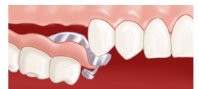
Prothèse dentaire amovible