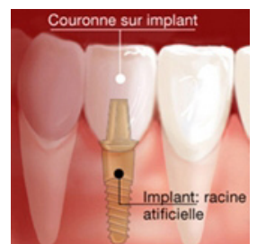
Couronne sur implant dentaire

Le choix d'une prothèse dentaire s'effectue en concertation avec votre chirurgien-dentiste